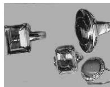
... mehrere Ringe ...