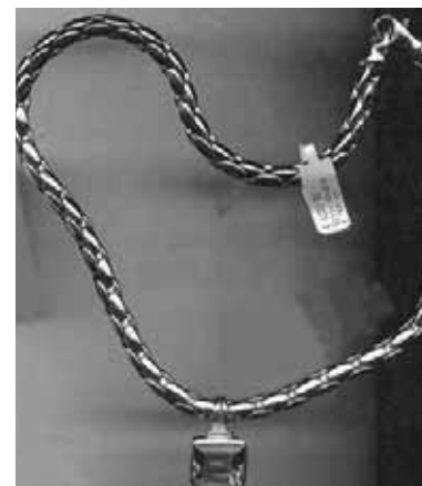
Einige Einzelteile des gestohlenen Schmucks: eine Goldkette ...

Die Kriminalpolizei Biberach bittet um Zeugenermeldungen zur beschriebenen Person oder dem Kleinwagen und um Hinweise zum Diebesgut unter Telefon 07351/4470